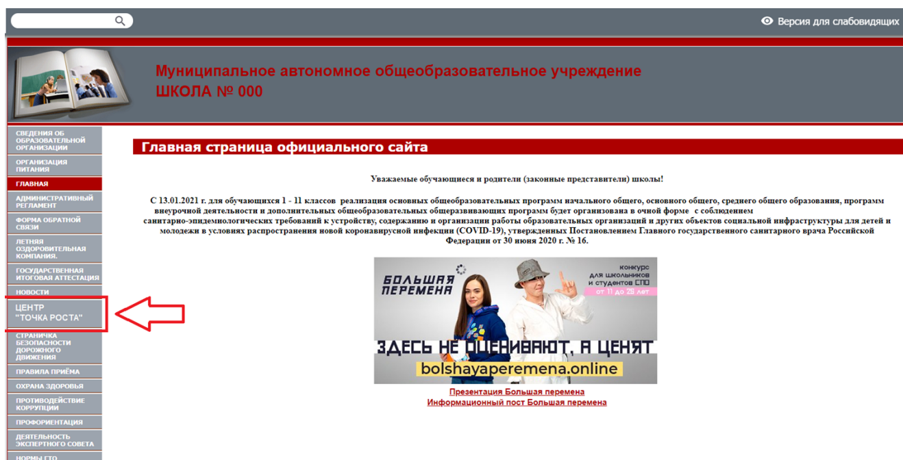
Рисунок 2. Пример размещения ссылки на раздел на сайте общеобразовательной организации

На официальном сайте общеобразовательной организации, в которой создается центр образования естественно-научной и технологической направленностей «Точка роста» (далее – центр «Точка роста», центр) в рамках федерального проекта «Современная школа» национального проекта «Образование», не позднее даты начала функционирования центра (не позднее 1 сентября года создания центра) создается раздел «Центр «Точка роста». Ссылка на раздел размещается в главном меню сайта общеобразовательной организации и должна быть видима при просмотре каждой страницы. Ссылка не может являться вложенной в другие меню. Пример размещения ссылки на раздел «Центр «Точка роста» в меню официального сайта общеобразовательной организации в информационно-телекоммуникационной сети «Интернет» приведен на рисунке 2.